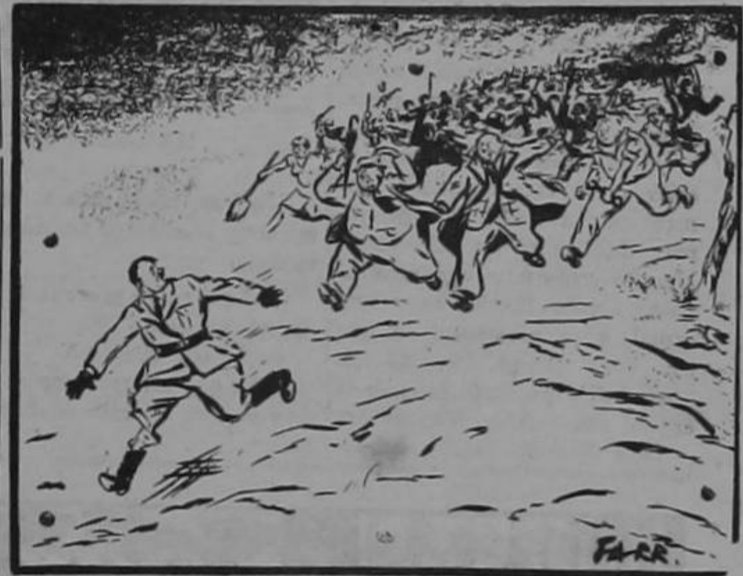
Sí, Adolfo, tienes detrás de tí a la nación entera...

Aquel profesor de matemáticas no podía tener jardín, porque a todas las plantas les sacaba la raíz.