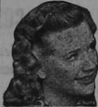
Priscilla Lane de la Warner Bros

LA cara, los brazos y las manos adquieren un aspecto fresco y encantador aplicando Crema Primavera antes de empolvase. Véalo en su espejo. El cutis marchito y macilento se esfuma y aparece la piel rosada y transparente que es tan atractiva y tan admirada.