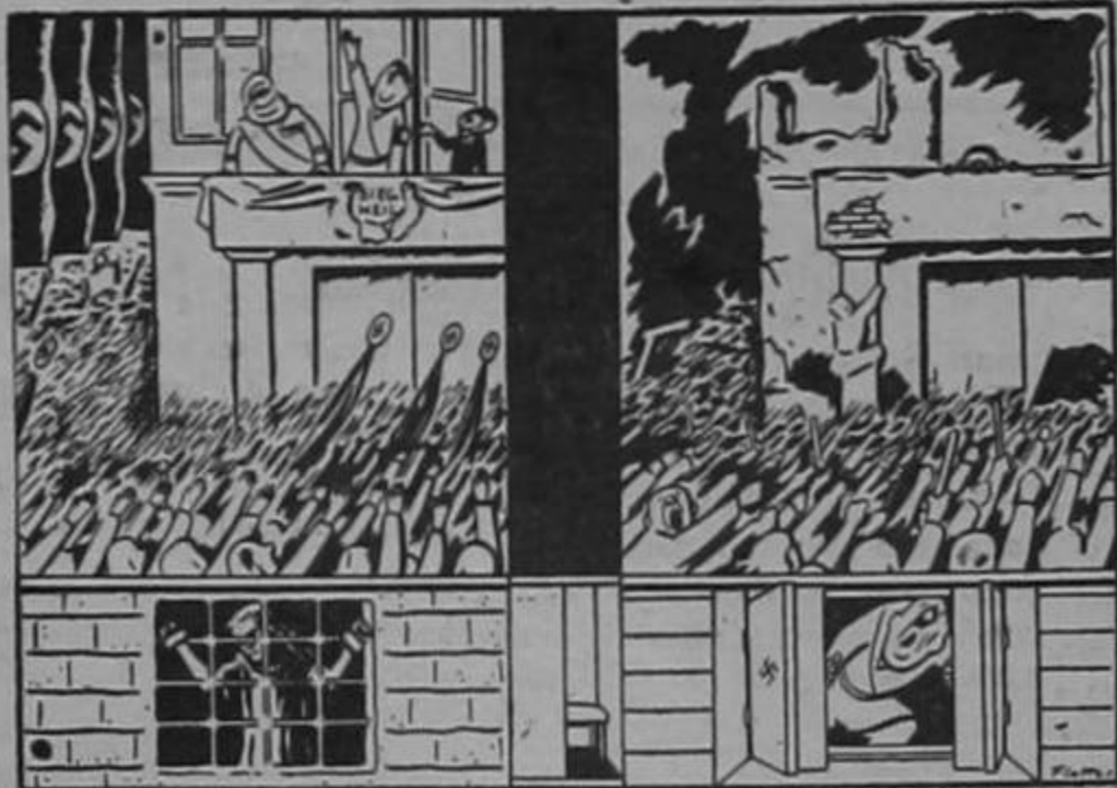
QUEREMOS VER AL FUEHRER Estilo 1940 Estilo 1943

Ya es hora de que calmen un poquito a los vendedores de calmantes.