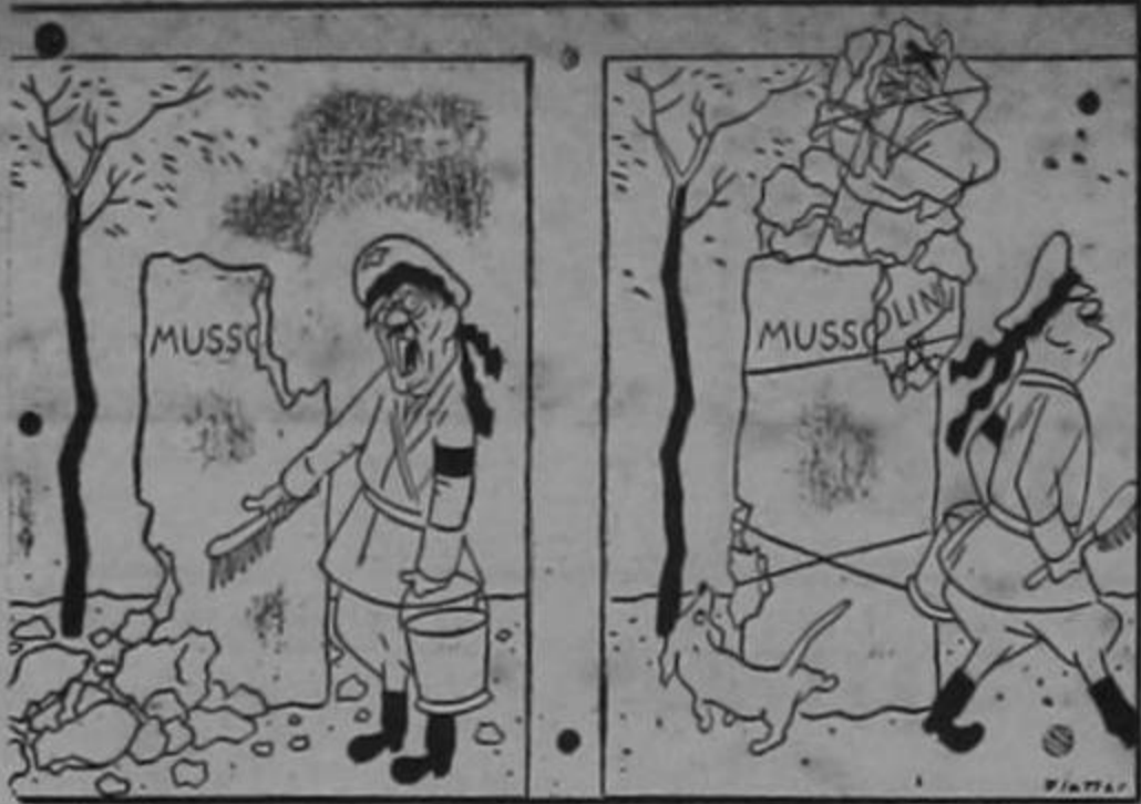
Hay cosas que no se pueden restaurar...