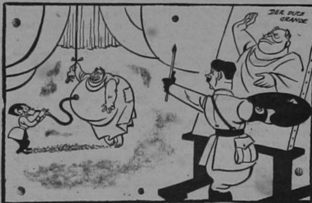
Dando los últimos toques...