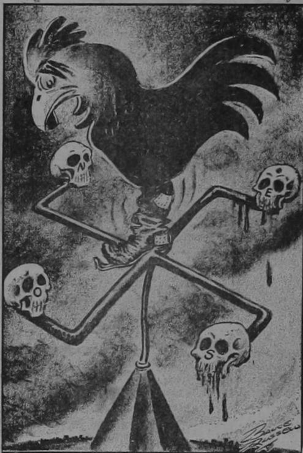
LA VELETA NAZI

Ahora bien, como resumen de todo esto, hay una realidad: que tenemos hombre en la casa y que Monseñor está dispuesto a terminar con los abusos y con los desórdenes en las Iglesias. ¡Viva Monseñor!