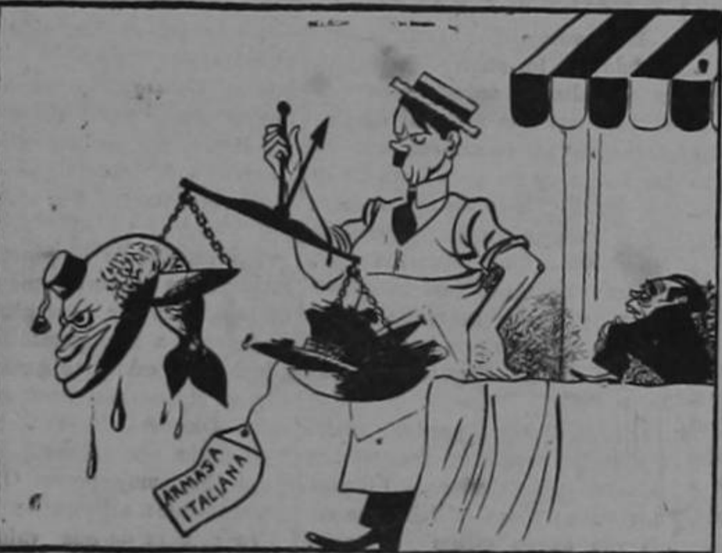
Falta de peso...

—No, señor: todavía tengo otras dos en el armario.